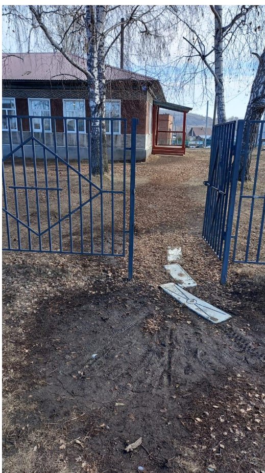
№ 1. Вход на территорию 1