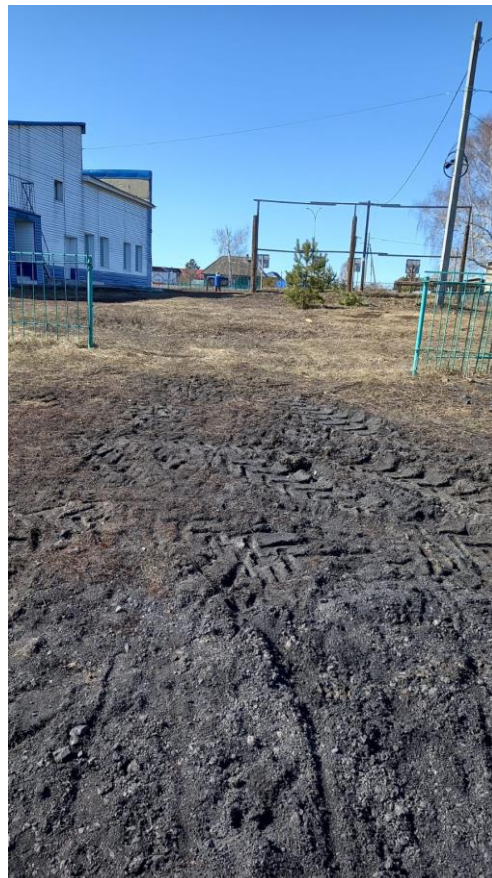
№ 4. Путь (пути) движения на территории