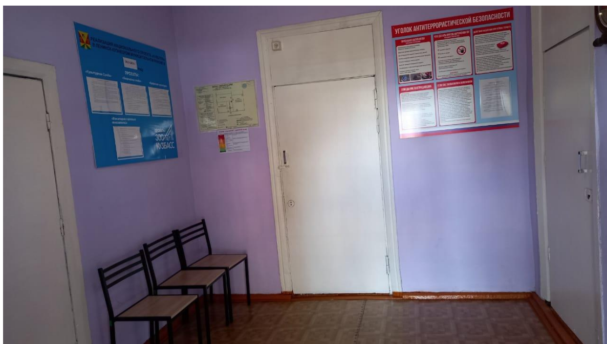
№ 7. Пути эвакуации (зоны безопасности)