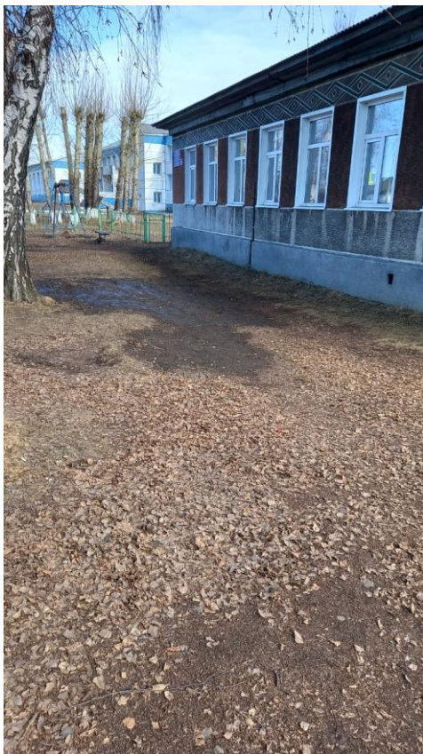
№ 3. Путь (пути) движения на территории